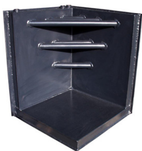
mod. ad angolo

La nostra ditta produce una gamma completa di caldaie camino che permette di fornire una soluzione per un'integrazione in qualsiasi camino già esistente o di nuova progettazione: