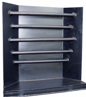
Mod. a parete